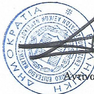
Σπ. Περβαινάς Αντιναύαρχος εα ΠΝ